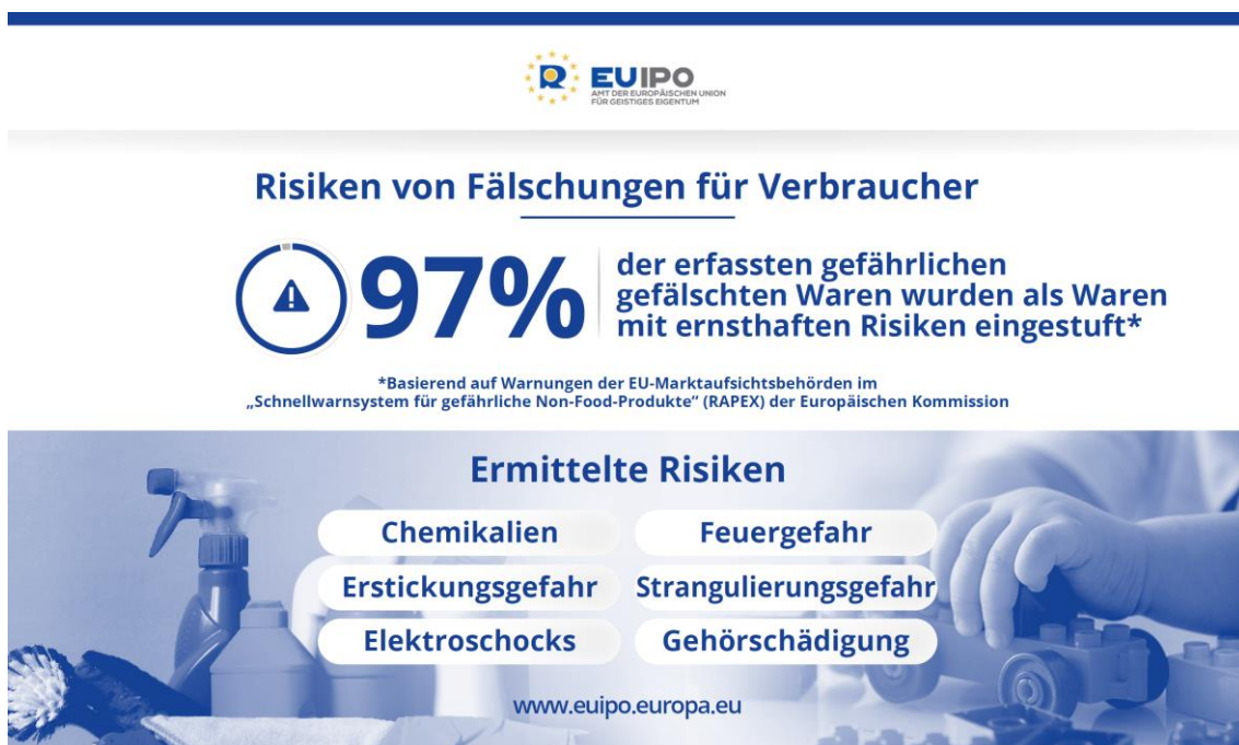
Abbildung 4: Risiken von Fälschungen für Verbraucher (Infografik EUIPO)