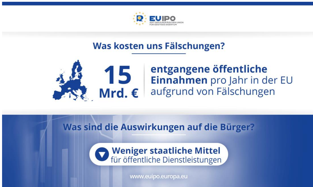
Abbildung 3: Was kosten uns Fälschungen? (Infografik EUIPO)